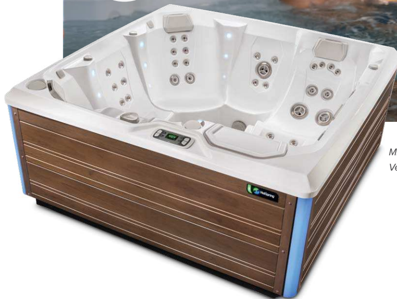
Mit Wanne in Alpin Weiß und Verkleidung in Sandfarben

Personen Sitzplätze Düsen Spannung 6 Sitzplätze Liege 43 Düsen 230 V