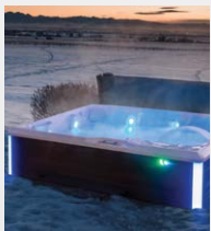
FiberCor® hochdichte Isolierung