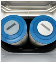
Zweifach-Filterung SilentFlo Umwälzung