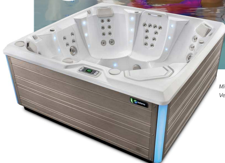
Mit Wanne in Alpin Weiß und Verkleidung in Grau

Personen Sitzplätze Düsen Spannung 7 Sitzplätze Ohne Liege 41 Düsen 230 V