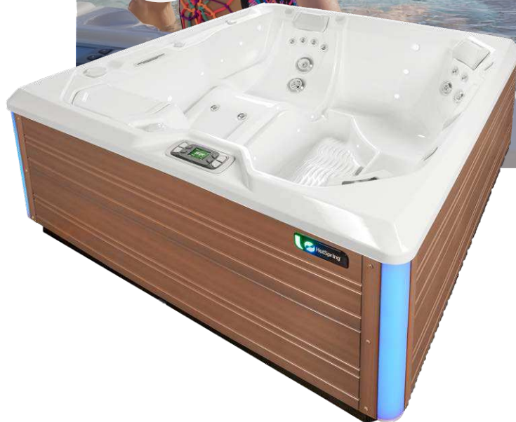
Mit Wanne in Alpin Weiß und Verkleidung in Sandfarben

Personen Sitzplätze Düsen Spannung 4 Sitzplätze Liege 23 Düsen 230 V