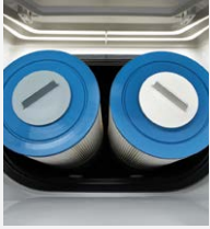
Zweifach-Filterung SilentFlo Umwälzung