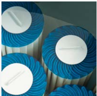
100% Filterung SilentFlo Umwälzung