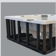
Polymer-Rahmen & Bodenwanne