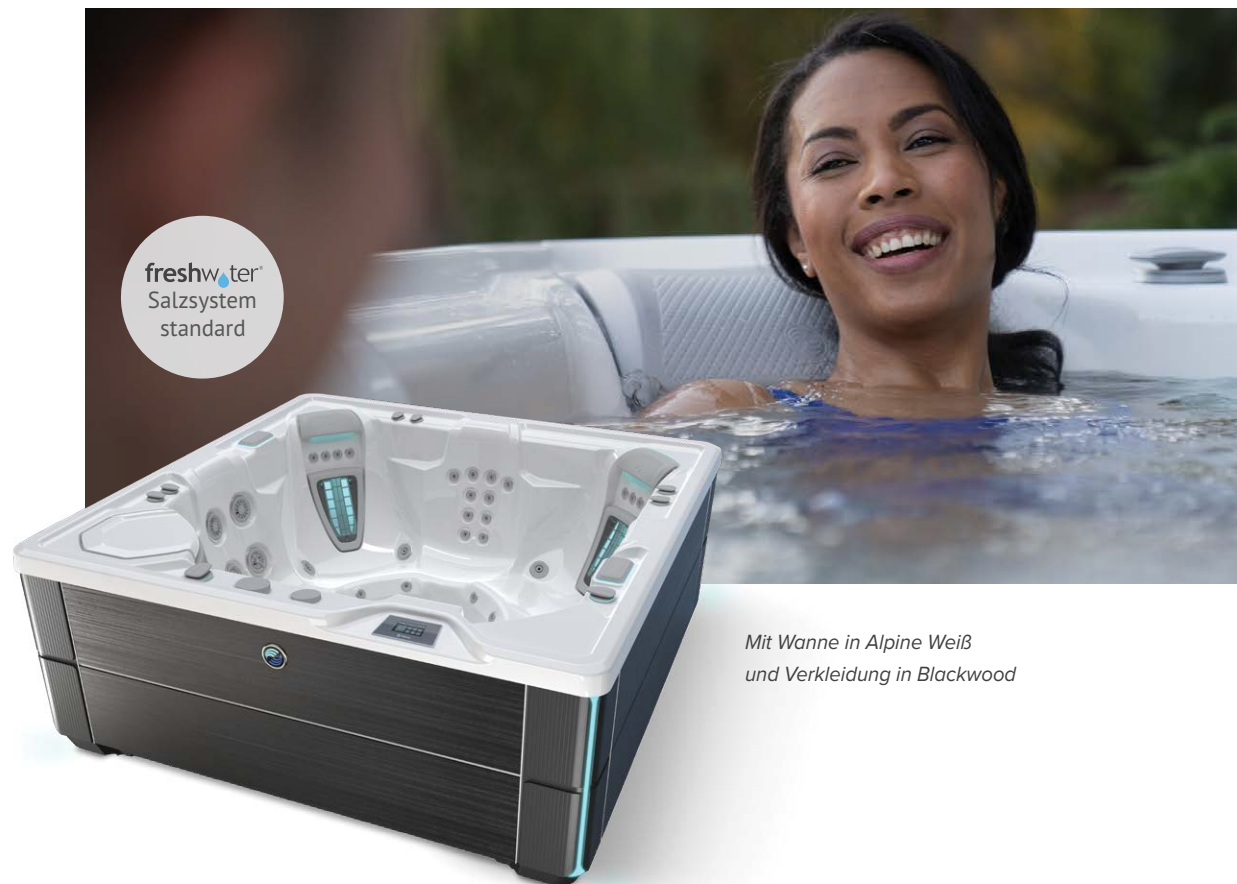
Mit Wanne in Alpine Weiß und Verkleidung in Blackwood

Personen Sitzplätze Düsen Spannung 6 Sitzplätze Ohne Liege 42 Düsen 230 V