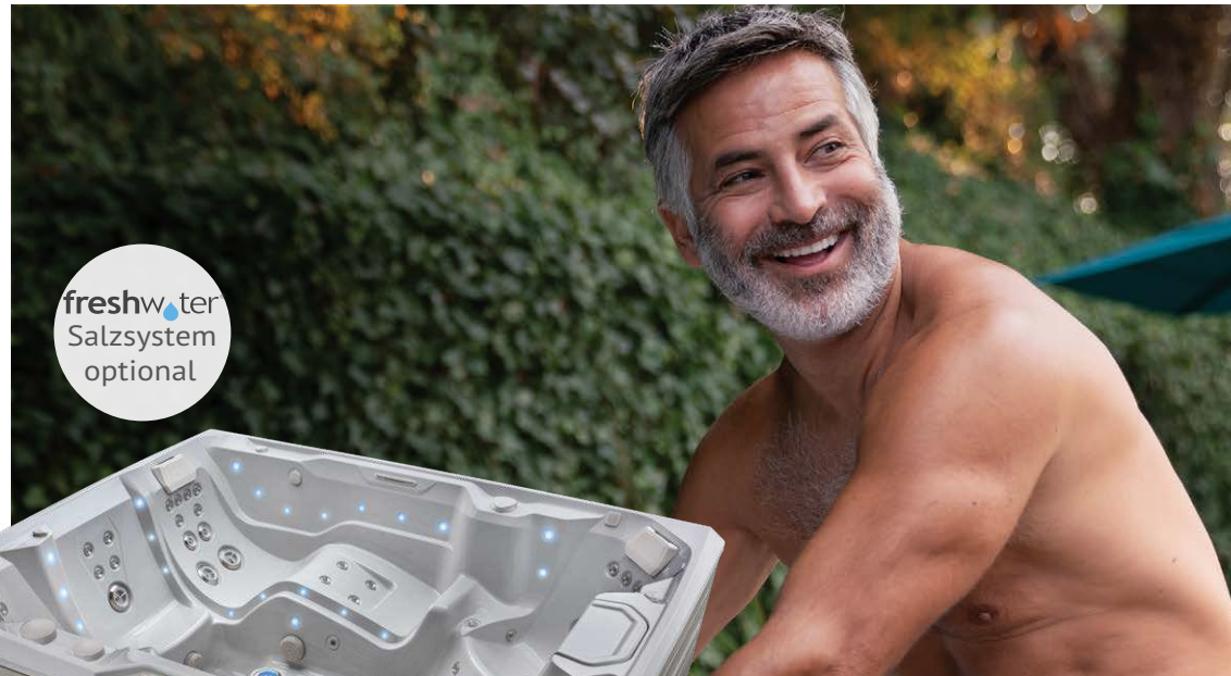
Mit Wanne in Eisgrau und Verkleidung in Grau

Personen Sitzplätze Düsen Spannung 7 Sitzplätze Liege 73 Düsen 230 V