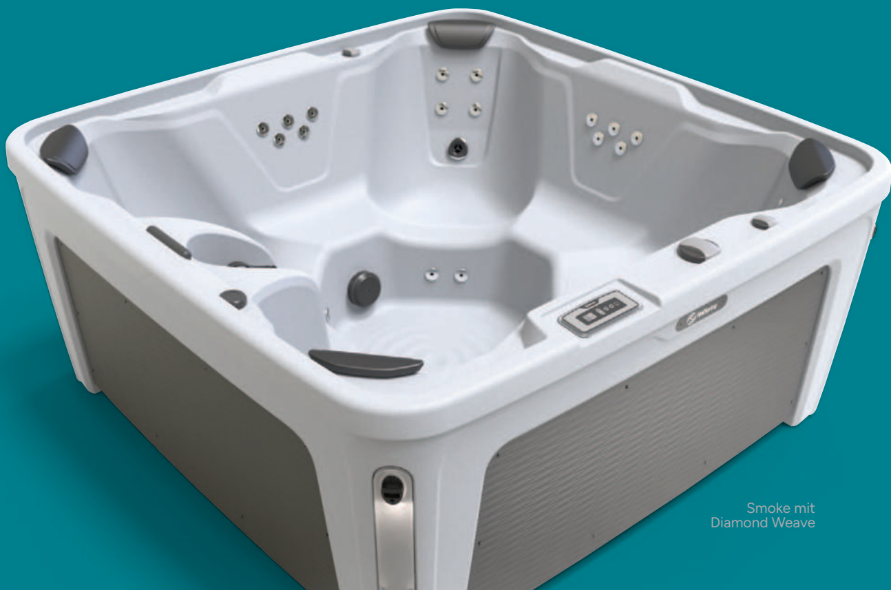
Smoke mit Diamond Weave

Whirlpools der Freeflow-Kollektion sind für das FROG®* Desinfektionssystem vorbereitet. Vorgefüllte Kartuschen setzen automatisch Brom frei, um das Wasser mit weniger Aufwand weich, sauber und klar zu halten.* Dieses System ist für eine Verwendung in den folgenden Ländern genehmigt: Österreich, Dänemark, Frankreich, Deutschland, Irland, Italien, Norwegen, Portugal, Schweden und Großbritannien.