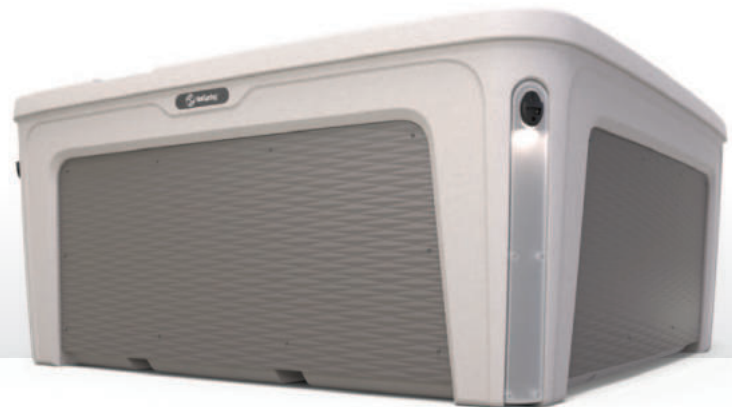
Dune mit Diamond Weave