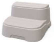
Verfügbar in Dune oder Smoke