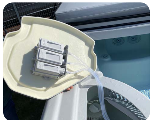
Abb. Dosierungssystem im Whirlpool ARIA™ der Highlife® Collection

Dosiert genau die benötigte Menge an pH +, pH - und Phosphatentferner – ohne Abmessen und ohne Verschütten. Dank nachfüllbarer Kartuschen, die elegant unter dem Filterdeckel untergebracht sind. Das Salzsysteem und das Smart Monitoring-System müssen installiert und betriebsbereit sein, damit das Dosierungssystem funktioniert.